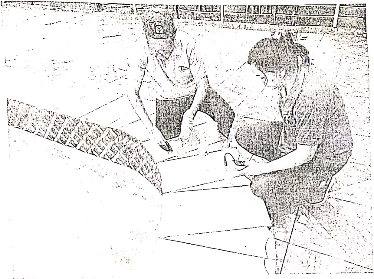
Figura 4. Toma de muestra de agua de piscina de un complejo recreativo