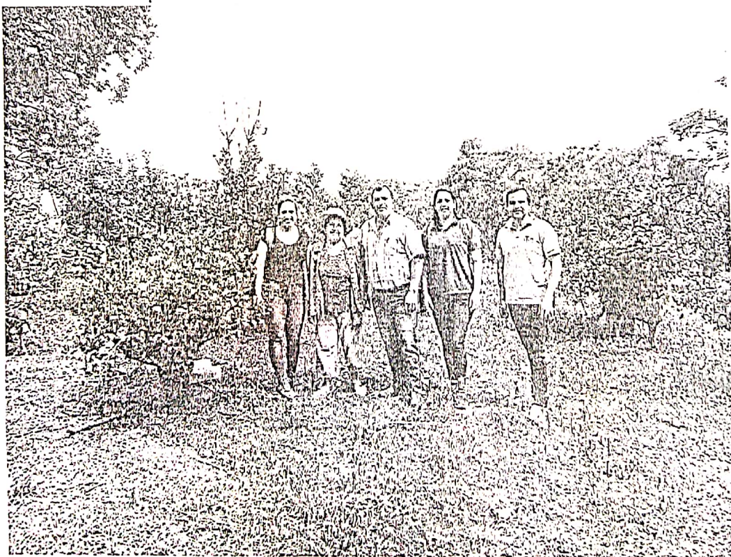
Figura 3. Muestreo Yerbales Antiguos zona Yatytay