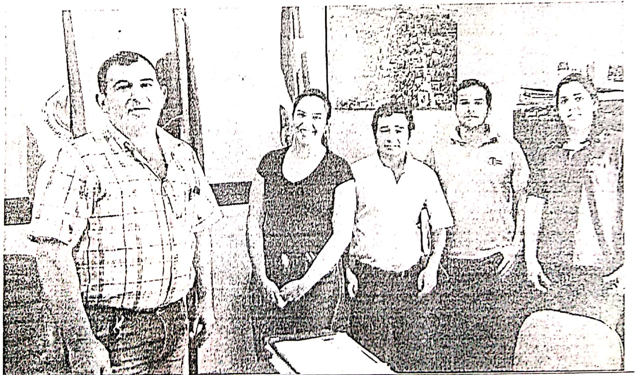
Figura 1. Visita Intendencia de Yatytay.

El laboratorio de agua de la Facyt ofrece los servicios de toma de muestra, análisis físico-químico, análisis microbiológico y biológico de diferentes tipos de muestras de agua.