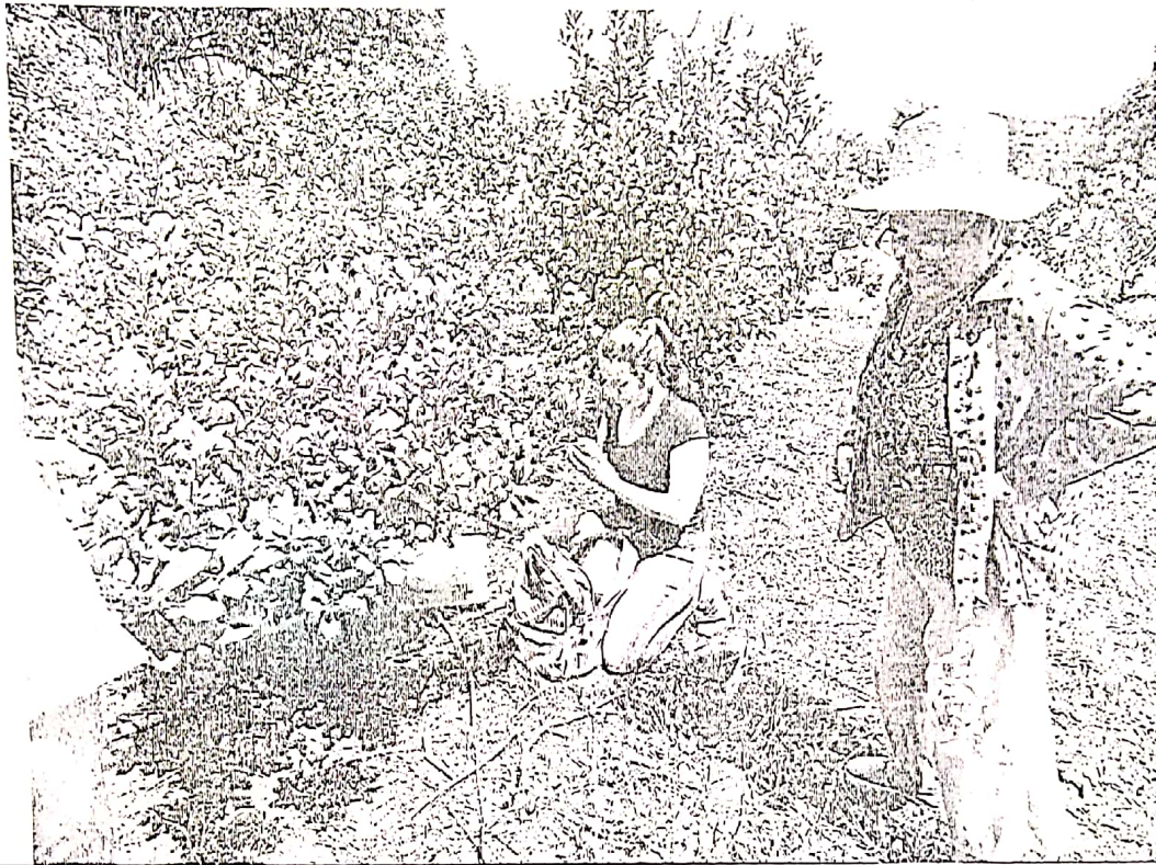
Figura 2. Geoposición y toma de muestras foliares de yerbales antiguos.